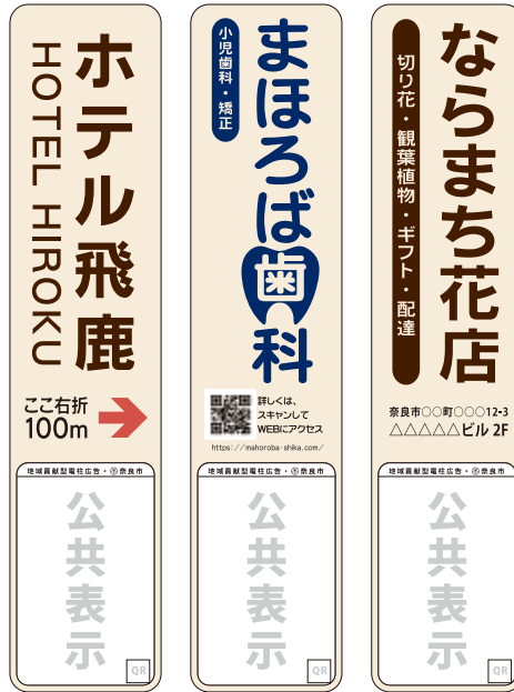
サンプルデザイン

掲出場所・デザインについては実証実験における細則によりご希望に添えない場合がございます。